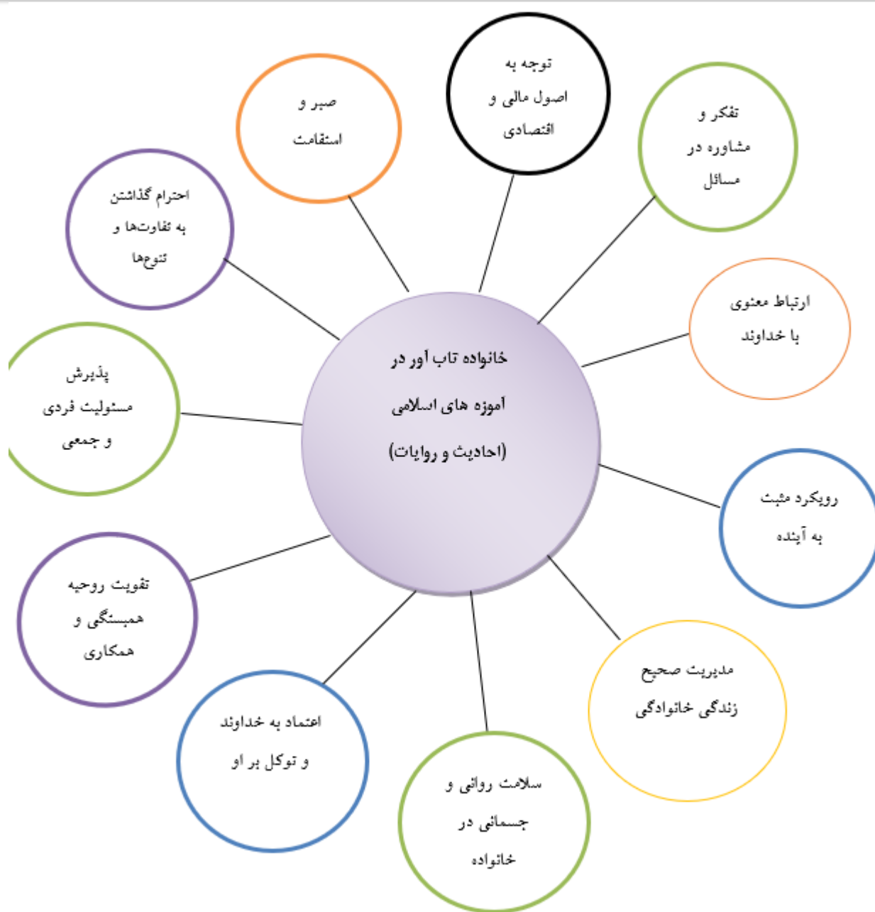
شکل ۱. خانواده تاب آور در آموزه های اسلامی (احادیث و روایات)